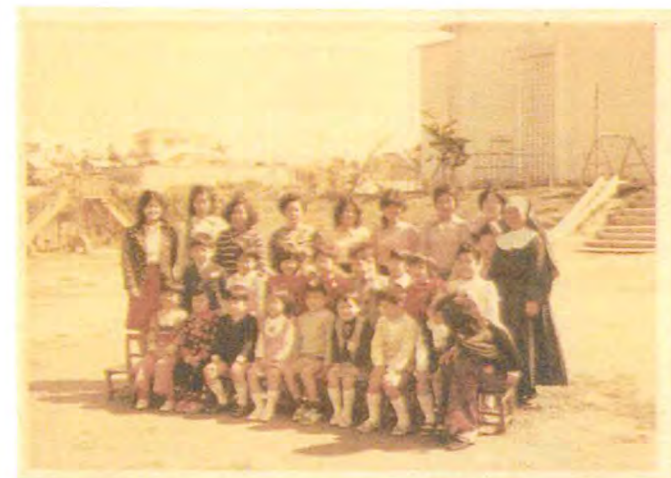
↑ 旧園庭にて記念撮影