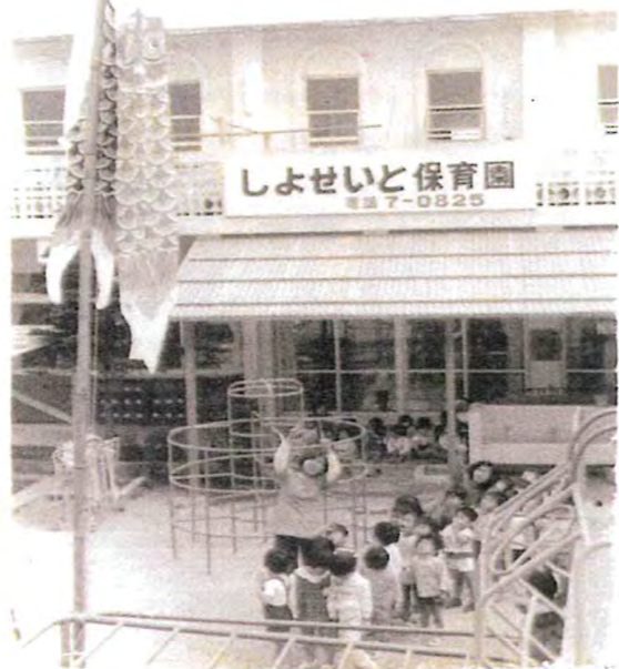
↑ 旧園舎・2階が教会でした