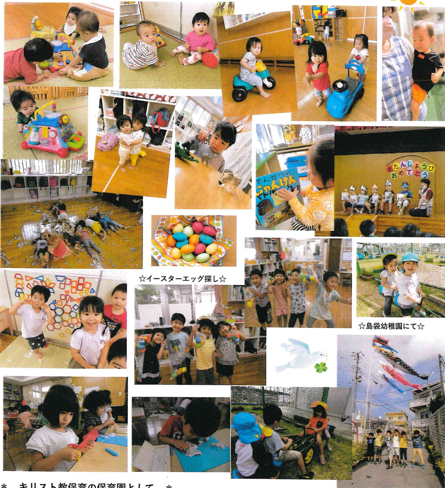
☆イースターエッグ探し☆